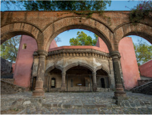
Capilla de la Asunción de Nuestra Señora