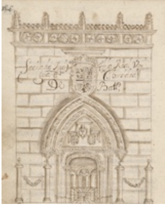
Universidad (fachada antigua)