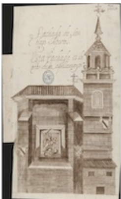
Iglesia de Santiago (Valladolid). Ventura Pérez