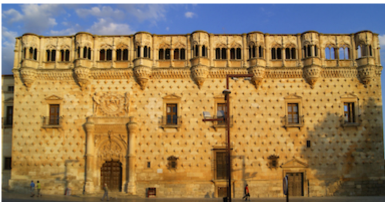
Fachada del Palacio del Infantado