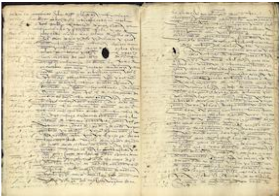
Contrato entre Lope del Castillo y Diego Hurtado de Mendoza y de la Cerda