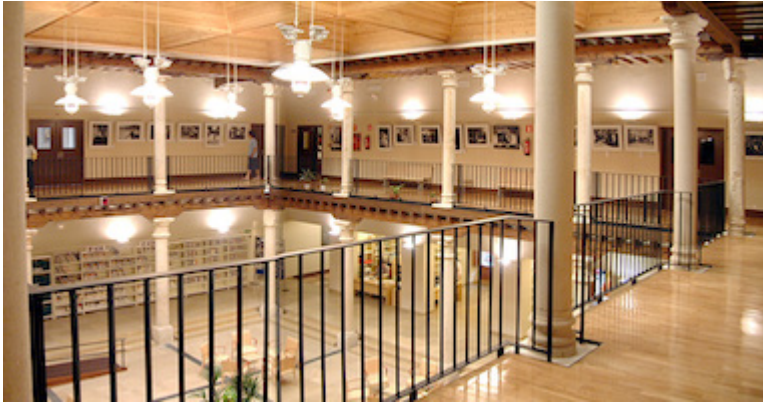
Interior del palacio Dávalos (actualmente Biblioteca Municipal)