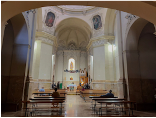
Convento de San José y Santa Ana (interior).