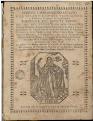
Festivo y armonioso aplauso (1737)