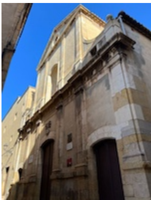
Convento de San José y Santa Ana. Fotografía de Sergi González