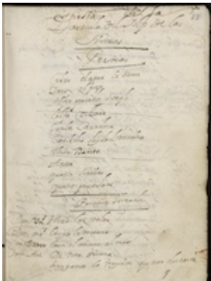
Fiesta de la zarzuela del