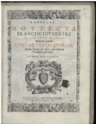
Superius. Mottecta . Francisco Guerrero (1589) [D-KI 4° Mus. 1]