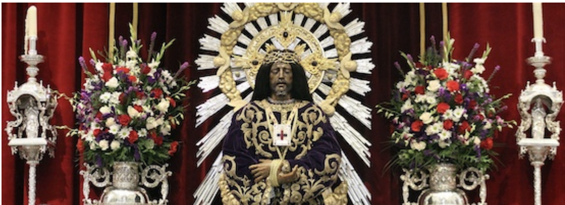
Jesús Nazareno (=Jesus de Medinaceli)