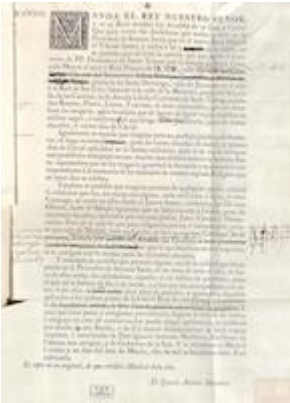
Bando de Semana Santa (21 de marzo de 1807)