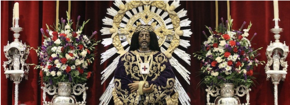
Jesús Nazareno (=Jesus de Medinaceli)