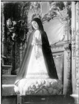
Nuestra Señora de la Soledad. Gaspar Becerra (1565)