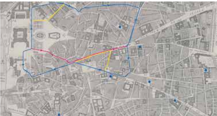
Variaciones en el itinerario de la procesión del Viernes Santo en Madrid (1804-1816)