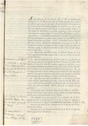
Decreto sobre la Semana Santa (4 de abril de 1805)