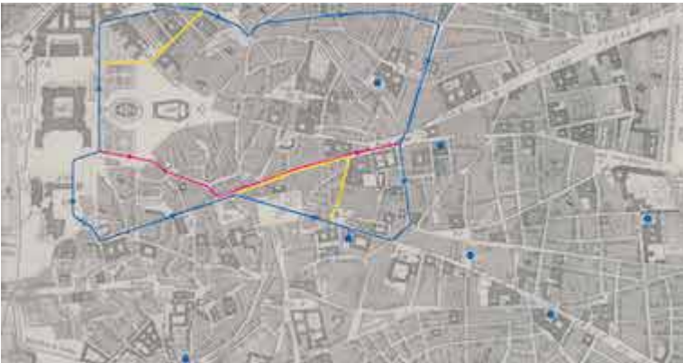
Variaciones en el itinerario de la procesión del Viernes Santo en Madrid (1804-1816)