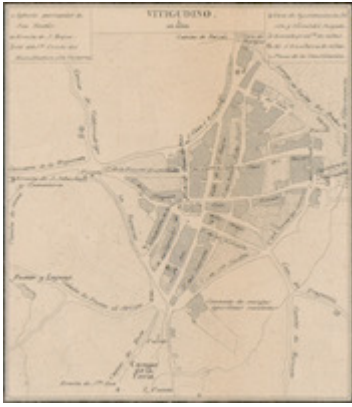
Vitigudino (1867). Imágenes del Atlas de España y sus posesiones de ultramar de Francisco Coello