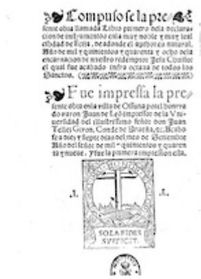
Libro primero de la Declaración de instrumentos. Juan Bermudo. Osuna: Juan de León, 1549