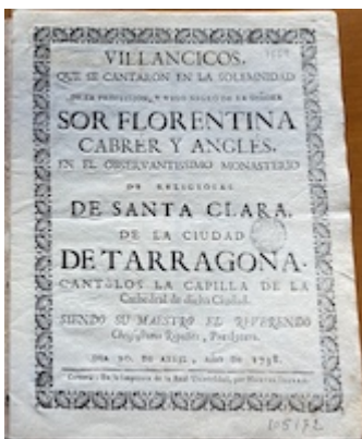
Villancicos que se cantaron... Sor Florentina Cabrer y Anglés (1738)