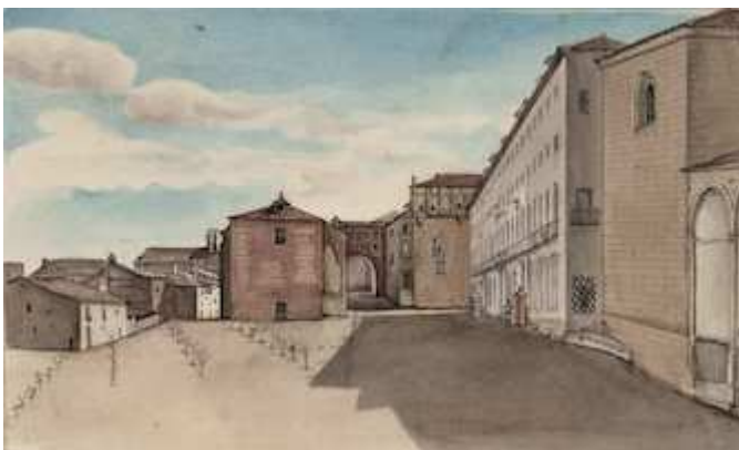
Ábside y arco de la iglesia de Santiago. Sandalio de Sancha (1841)