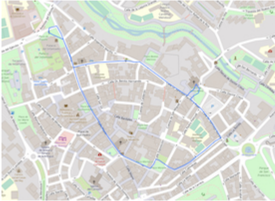
Reconstrucción del itinerario histórico de la procesión del Corpus Christi en Guadalajara