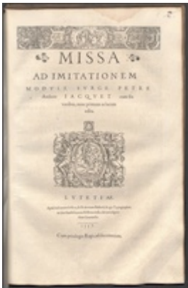
Missa ad imitationem moduli Surge Petre, auctore Jacquet cum sex vocibus. Jacquet de Mantua (1557)