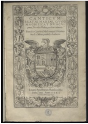
Canticum Beatae Mariae quod magnificat nuncupator. (Lovaina: Pierre Phalèse, 1563) [G 4867]. Francisco Guerrero