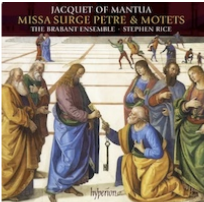
Missa Surge Petre. Jacquet de Mantua