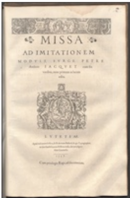
Missa ad imitationem moduli Surge Petre, auctore Jacquet cum sex vocibus. Jacquet de Mantua (1557)