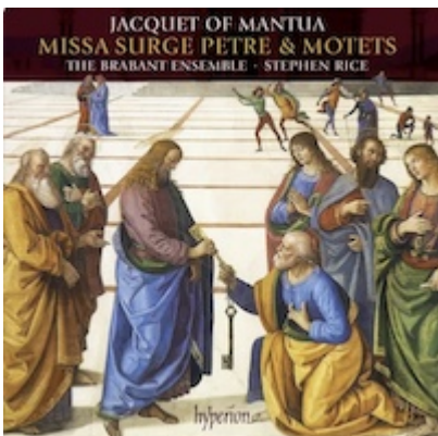
Missa Surge Petre. Jacquet de Mantua