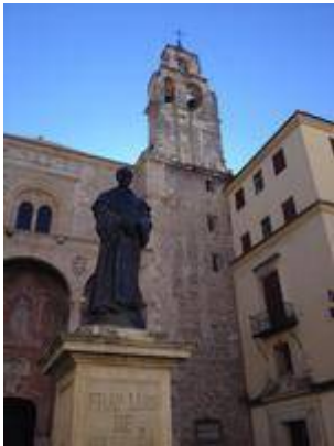
Convento de Santa Cruz la Real