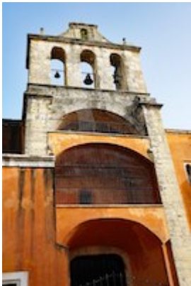
Espadaña. Convento de los dominicos. Santo Domingo (Republica Dominicana)