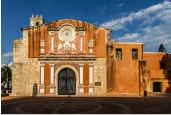
Convento de los dominicos. Santo Domingo (Republica Dominicana)