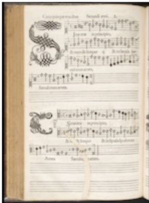
Canticum Beatae Mariae quod magnificat nuncupator . KU Leuven Bibliotheken, sig. RC81, fol. 24v