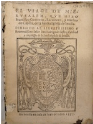
Portada. El viaje de Jesusalén . Francisco Guerrero (Sevilla, 1593)

"https://embed.spotify.com/?uri=spotify:track:3G4JwlggHq4nXvQMKGZuHq"