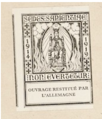
Etiqueta en guarda delantera Canticum Beatae Mariae quod magnificat nuncupator . KU Leuven Bibliotheken, sig. RC81