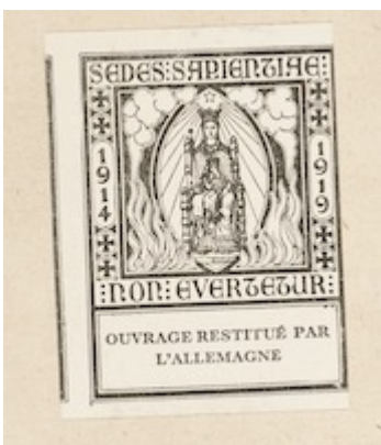
Etiqueta en guarda delantera Canticum Beatae Mariae quod magnificat nuncupator . KU Leuven Bibliotheken, sig. RC81