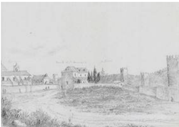
Convento de los Capuchinos. Richard Ford (1831)