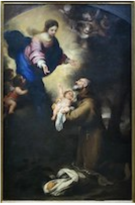
San Félix Cantalicio. Bartolomé Esteban Murillo (1668-1669)