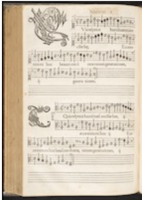
Canticum Beatae Mariae quod magnificat nuncupator . KU Leuven Bibliotheken, sig. RC81. fol. 63v