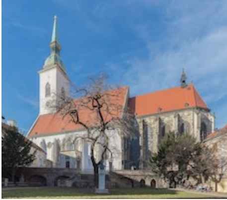
Colegiata de San Martín (actualmente catedral)