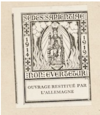
Etiqueta en guarda delantera Canticum Beatae Mariae quod magnificat nuncupator . KU Leuven Bibliotheken, sig. RC81