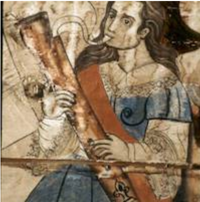
Bajonista. Iglesia de Santiago. Nurio (Michoacán)