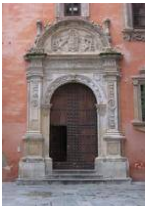
Portada del Colegio Real (Universidad de Granada). Fotografía de Juan Ruiz Jiménez