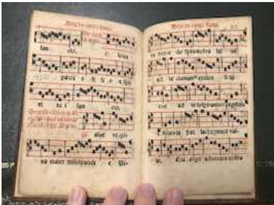
"Salve regina". Juan Martínez. Arte de canto llano . (Alcalá: Diego de Angulo, 1565)