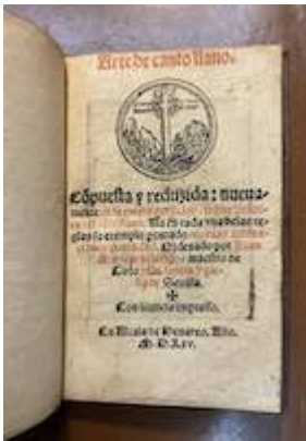
Portada. Juan Martínez. Arte de canto llano . (Alcalá: Diego de Angulo, 1565)