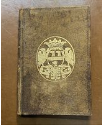
Encuadernación. Juan Martínez. Arte de canto llano . (Alcalá: Diego de Angulo, 1565)