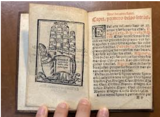
Mano guioniana. Juan Martínez. Arte de canto llano . (Alcalá: Diego de Angulo, 1565)