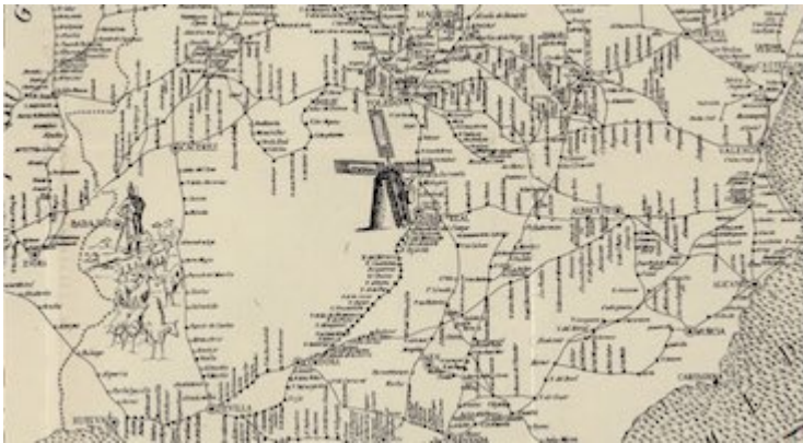
Ruta de Sevilla a Madrid. Reportorio [sic] de todos los caminos de España . Juan Villuga (1546)