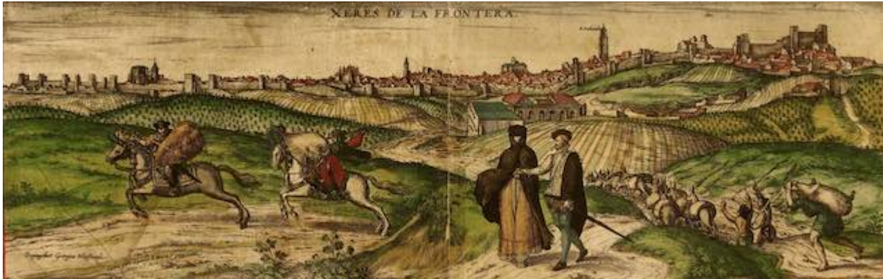
Jerez de la Frontera. Joris Hoefnagel. Georg Braun. Civitates Orbis Terrarum , vol. 2. Colonia, 1575