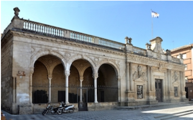
Antiguas casas del cabildo municipal (siglo XVI)