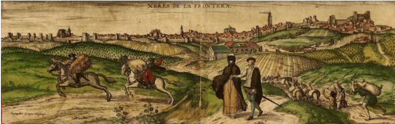
Jerez de la Frontera. Joris Hoefnagel. Georg Braun. Civitates Orbis Terrarum , vol. 2. Colonia, 1575