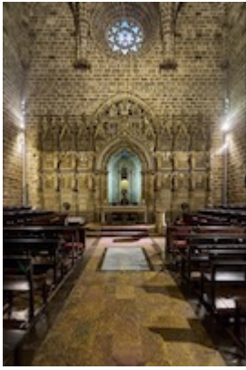
Capilla del Santo Cáliz. Catedral de Valencia