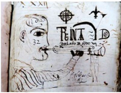
Libro de protocolos nº 32 de Alonso Sánchez de la Cruz