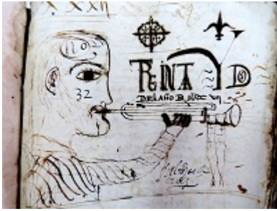
Libro de protocolos nº 32 de Alonso Sánchez de la Cruz