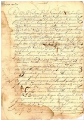
Real Provisión de 2 de marzo de 1601