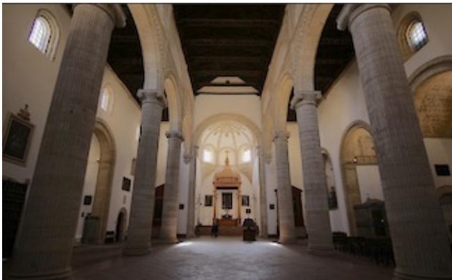
Colegiata de Santa María la Mayor (interior). Antequera.