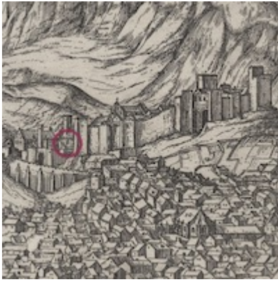
Antiguas casas del cabildo municipal (siglo XVI)