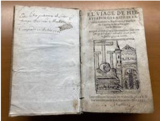
Portada. Francisco Guerrero. El viage de Hierusalem . Valencia: herederos de Juan Navarro, 1593