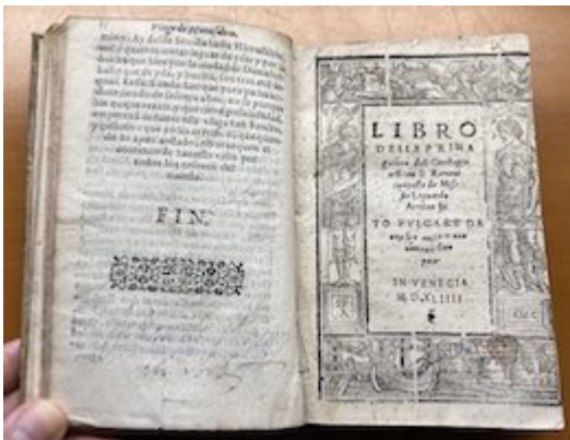
Francisco Guerrero. El viage de Hierusalem . Valencia: herederos de Juan Navarro, 1593, fol. 51v