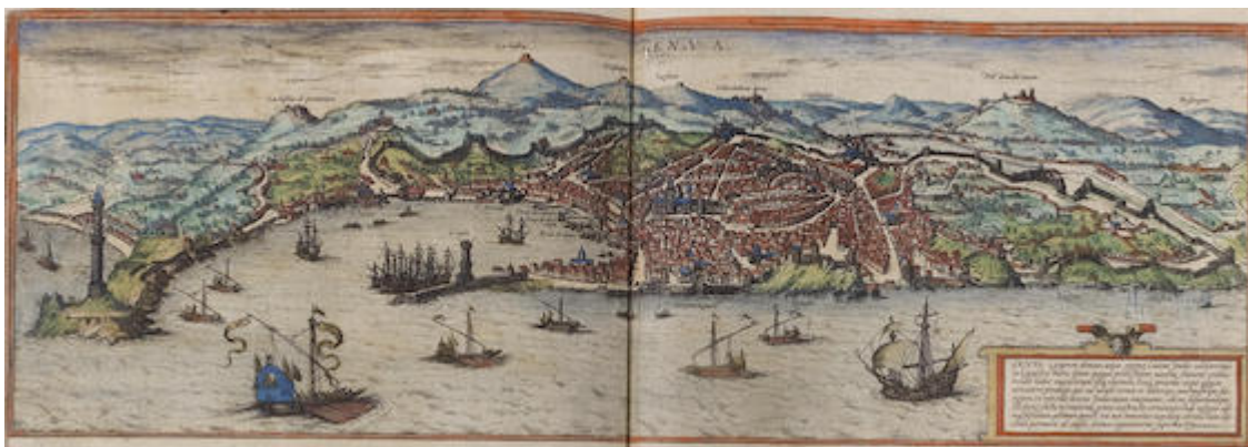
Génova. Beschreibung vnd Contrafactur der vornembster Stät der Welt , vol. 1, fol. 45v (1582). Georg Braun, Franz Hogenberb