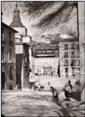
Costanilla de San Andrés