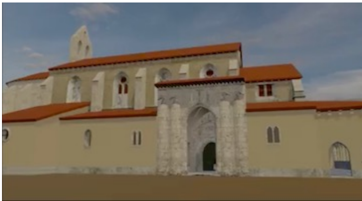
Reconstrucción virtual del convento de San Francisco de Valladolid (vídeo)