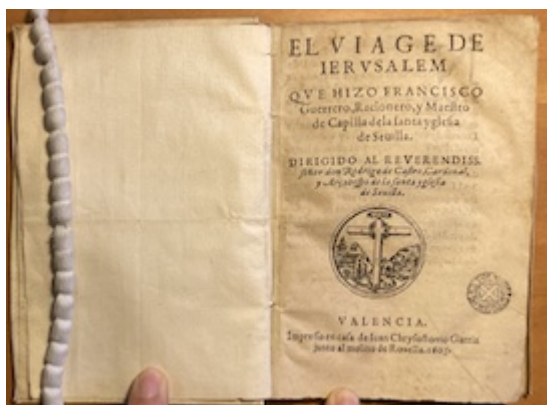
El viage de Iervsaalem (1603) [E-Bbc Res. 247-12]