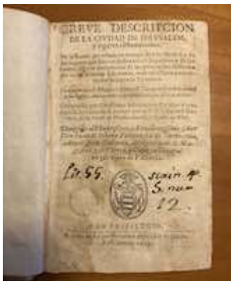
Breve descripción de la ciudad de Jerusalén (1603) [E-Bbc 7-I-1/1]