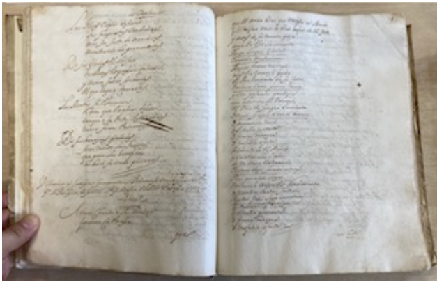
Villancico para la procesión del Corpus Christi (1727), fols. 27v-28r