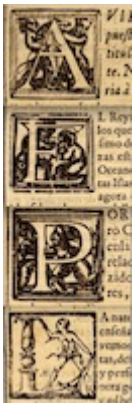
Iniciales xilográficas. Historia de cosas del Oriente . Amaro Centeno. Córdoba: Diego Galván, 1595