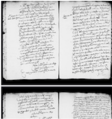
Acuerdo capitular (02/07/1612), vol. 31, fol. 67v-68v