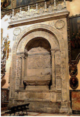
Tumba de Francisco Guerrero al pie del monumento funerario de Luis Salcedo y Azcona