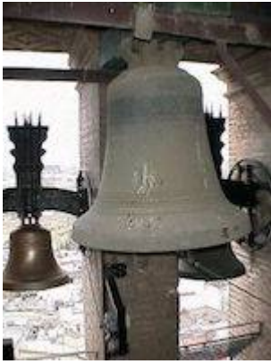
Campana Santa Catalina (1599). Catedral de Sevilla