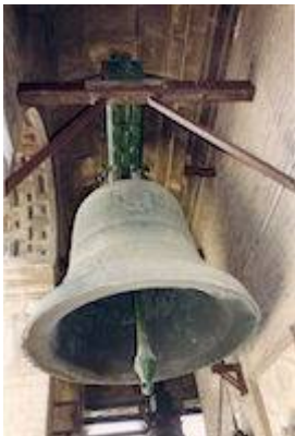
Campana Santa María (1588). Catedral de Sevilla. Juan de (Valdecilla) Balabarca.