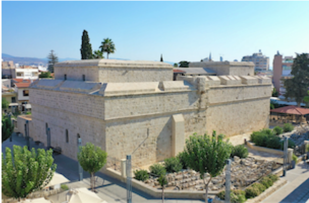
Fortaleza de Limasol