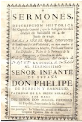
Sermones y descripción histórica del Capítulo General... , (Valladolid, 1741)