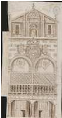
Fachada del convento de San Francisco. Ventura Pérez (c. 1760)