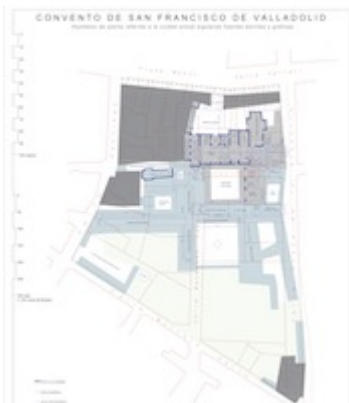
Convento de San Francisco de Valladolid. Hipótesis de Planta. Sáiz Virumbrales / Castro Sánchez (2021)