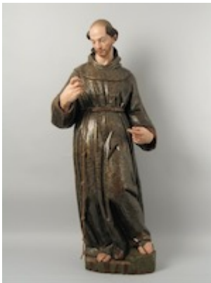
¿San Pedro de Alcántara?. Procedente del convento de San Diego de Valladolid