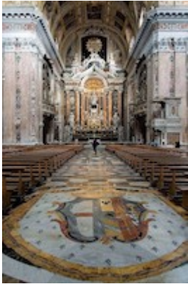
Iglesia del Gesù Nuovo