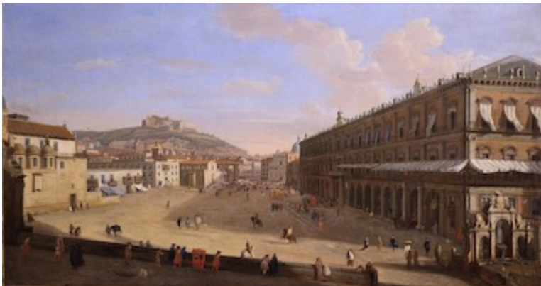
Vista del Largo di Palazzo. Gaspar van Wittel (c. 1700-1725)