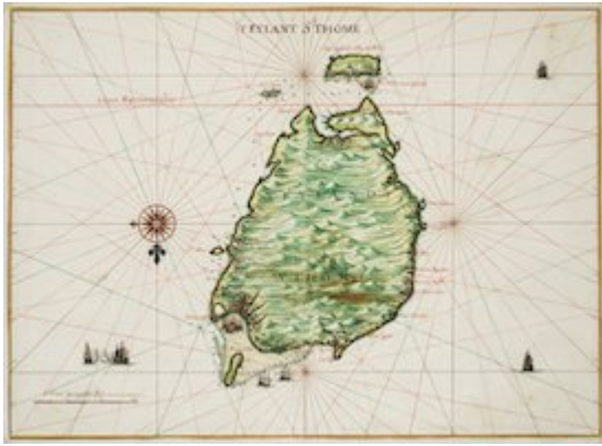
I. Eylant St. Thome. Johannes Vingboons (1665)