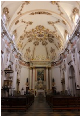
Convent of la Santísima Trinidad in Valencia