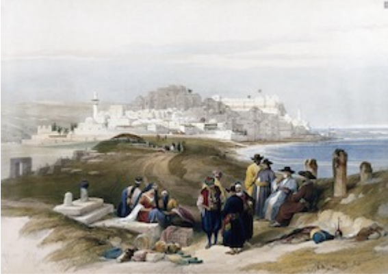
Jaffa. David Roberts (1839)