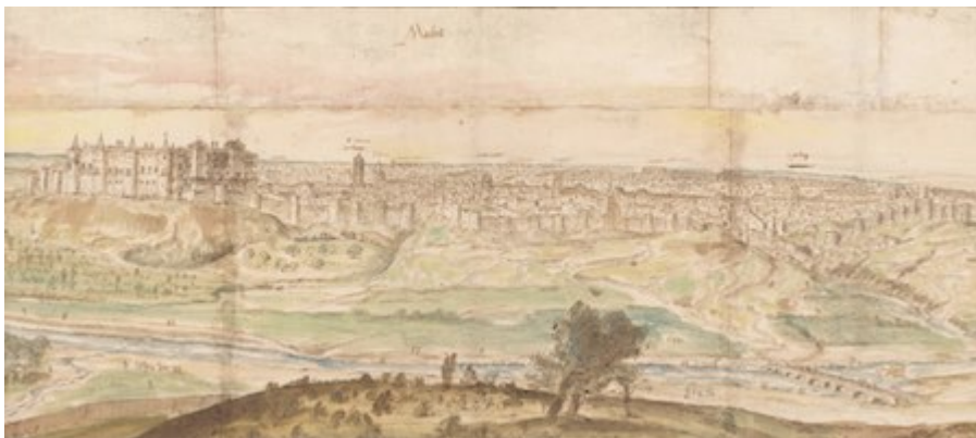
Madrid. Anton van den Wyngaerde (1562)