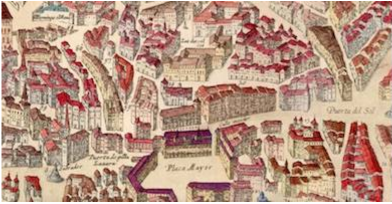
La Villa de Madrid Corte de los Reyes Católicos de España. (detalle). Antonio Mancelli (1622)