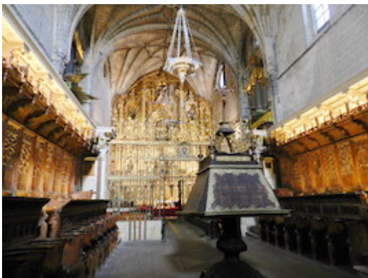
Coro de la catedral de Coria.