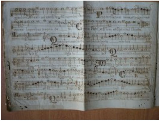
Lauda Jerusalem. 8º Tono. Tiple. [Francisco Guerrero] [GCA-Gc Papeles de Música 451]