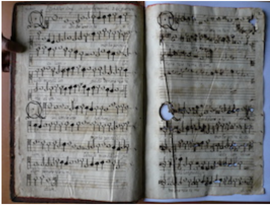
Qui condolens interitum [Francisco] Guerrero [GCA-Gc Ms. 2, fols. 1v-2r]