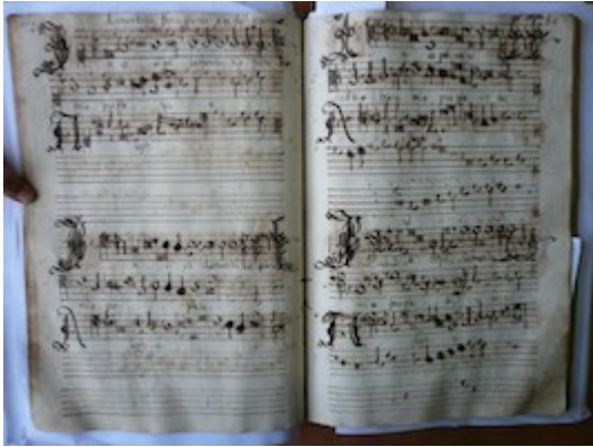
Incipit lamentatio Hieremias prophet. Francisco Guerrero [GCA-Gc Ms. 4, fols. 79v-80r]