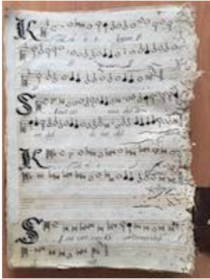
Sicut cervus [Francisco Guerrero] [GCA-Gc Ms. 3, fol. 76v]