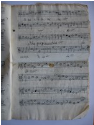
Requiem aeternam. [Francisco Guerrero] [GCA-Gc Ms. 6, s.f.]