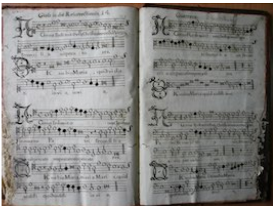
Agnus redimit [Francisco] Guerrero [GCA-Gc Ms. 1, fols. 190v-191r]