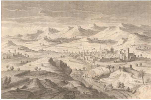
Vue de la ville de Rama située a l'occident de Jerusalem, entre Lydda et Joppé. Antoine Augustin Calmet (1730)