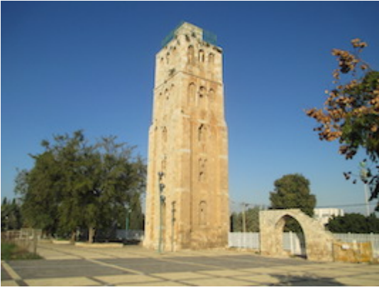
Mezquita Blanca (iglesia de los Cuarenta Mártires)