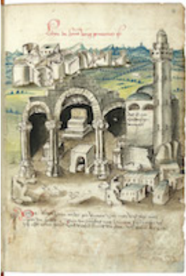
Ruinas de la iglesia de San Jorge y mezquita en Lydda. Konrad von Grünenberg (1487)