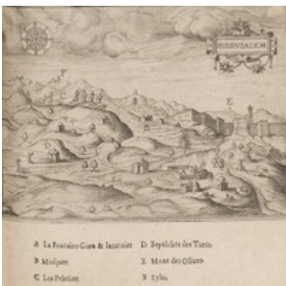
Hierusalem . Jean Zuallart (1587)