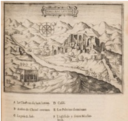
Domus boni latronis . Jean Zuallart (1587)