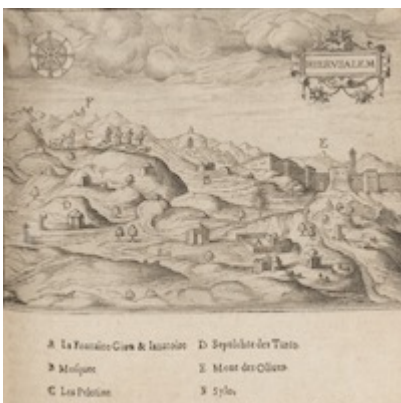
Hierusalem . Jean Zuallart (1587)