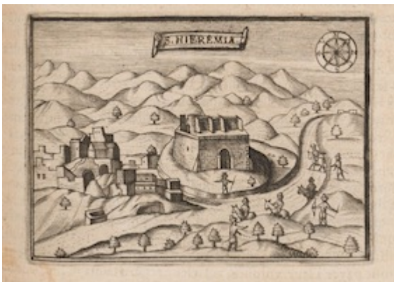
S. Hieremia . Jean Zuallart (1587)