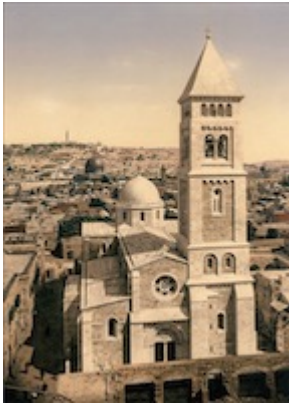
Convento de San Salvador (c. 1900)