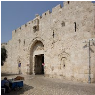
Puerta de Sión