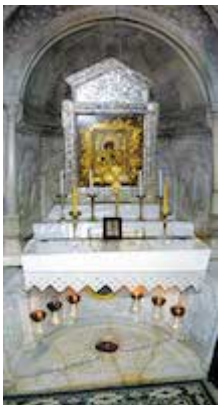
Capilla de la Degollación. Catedral de Santiago (armenia)